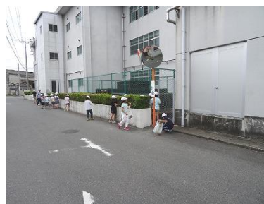
【2年生：小学校周辺にて】