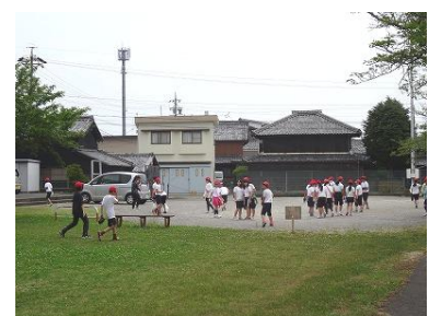
【6年生：王中島公民館にて】