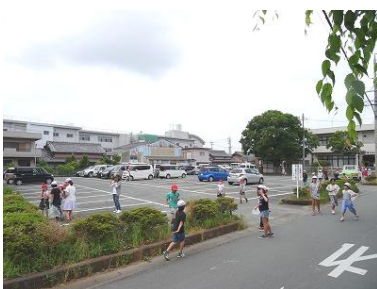
【4年生：御園総合支所にて】