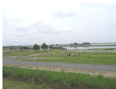
【5年生：ラブリバー公園にて】