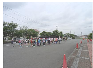
【3年生：ハートプラザにて】